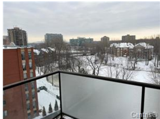
Vue sur l'eau